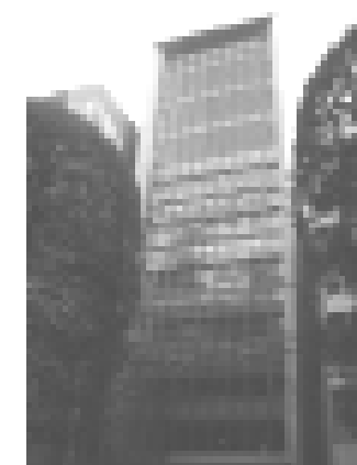
中津から淀屋橋に事務所が移転しました！是非遊びにきてください！